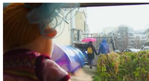
Рисунок 4 - Кадры видеовизитки участников профессионально-творческого конкурса «Шоу двойников».