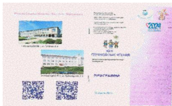
Рисунок 5 - Результаты представления контента