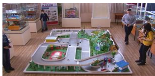
Рисунок 3 - Кадры видеопрезентации бизнес-проекта «PMTrack»