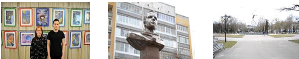
Рисунок 2 - Кадры видеодайджеста «Космический проспект»