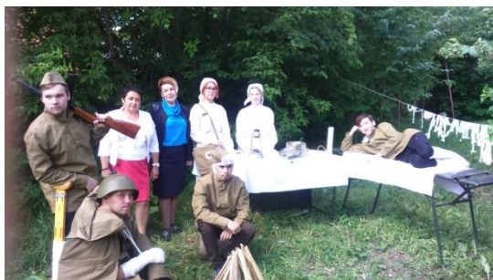
ФОТО С МЕРОПРИЯТИЙ