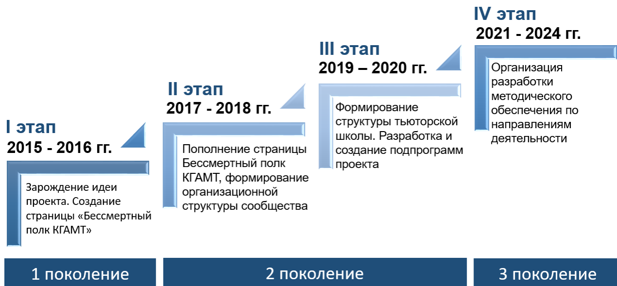
Рисунок 1 - Этапы реализации проекта

СПО «Правнуки – Прадедам» создано в 2015 г. За 9 лет в коллективе выросло 4 поколения организаторов, около 60 человек, которые в свою очередь вовлекли в работу около 5000 студентов.